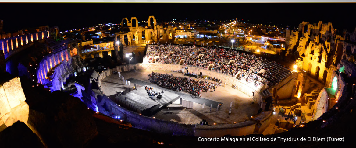
Concerto Málaga en el Coliseo de Thysdrus de El Djem (Túnez)

La orquesta ha cautivado audiencias en Alemania, Finlandia, Francia, Corea del Sur, Croacia, Holanda, Eslovenia, España, Estados Unidos, Italia, Irlanda, Túnez o Reino Unido, presentándose en escenarios tales como Berlin Philharmonie, Laeiszhalle Hamburg, Prinzregententheater Munich, Rosengarten Mannheim, Seoul Arts Center, Busan Cultural Center, Basílica del Real Monasterio de San Lorenzo de El Escorial, Capilla del Palacio Real de El Pardo (Madrid), Balboa Theatre (San Diego), Majestic Empire (San Antonio), Valley Performing Arts Center (Los Angeles) o Lehman Center for the Performing Arts (Nueva York). Son destacables sus actuaciones en numerosos festivales, como «Euriade Festival» (Holanda), «Festival L Été Musical en Bergerac» (Francia), «Festival Musika Kalevi Aho» (Finlandia), «Festival International de Musique Symphonique d'EL Jem» (Túnez), «International Summer Music Festival Zadar» (Croacia) o «Festival Internacional de Música y Danza Cueva de Nerja» (España).