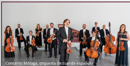
Concerto Málaga, orquesta de cuerda española

Orquesta de cuerdas española de contrastada calidad internacional, fundada en 1996 por un grupo de jóvenes músicos andaluces que retoman el espíritu musical legado por los compositores pertenecientes a la Generación del 98 en pro de la protección y divulgación de la música docta occidental de raíz e inspiración hispana. Aclamado por sus interpretaciones de música española e integrado por artistas europeos dedicados a la investigación, estudio e interpretación del repertorio para cuerdas que abarca desde finales del siglo XVII hasta nuestros días, Concerto Málaga es según la revista especializada alemana Ensemble Magazine «uno de los mejores conjuntos españoles» y según la radio americana WFMT Chicago Classical, «uno de los conjuntos más importantes de España». En palabras del célebre guitarrista Pepe Romero, «Concerto Málaga le dará a Málaga lo que I Musici le ha dado a Italia».